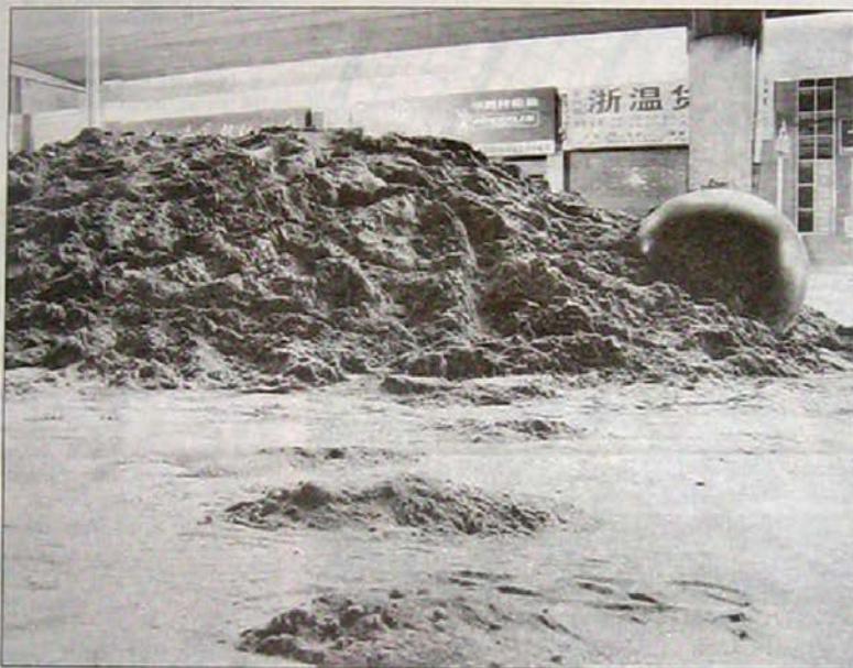
Spaceball, luz de neón sobre bola de metal y montaña de arena. Chongqing, 2007

Las calles, los puentes peatonales, las plazas, son paisajes que la gente construye muchas veces, como se dijo, por necesi-