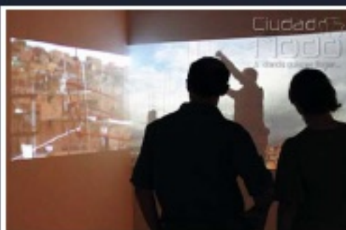
Construcción de una casa en Barrio de Villa Gloria, Bolívar

resultados y obra terminada, en cambio, los audiovisuales muestran el camino para lograrlo. Producto arquitectónico a base de hilo, el cual nos representa la historia y proyección de una construcción, en la que los colores son de suma relevancia; el hilo negro tensado forma parte de los acuerdos de la familia para hacer la nueva construcción, el hilo rojo, refleja la incertidumbre, debido a los conflictos y desacuerdos entre ellos.