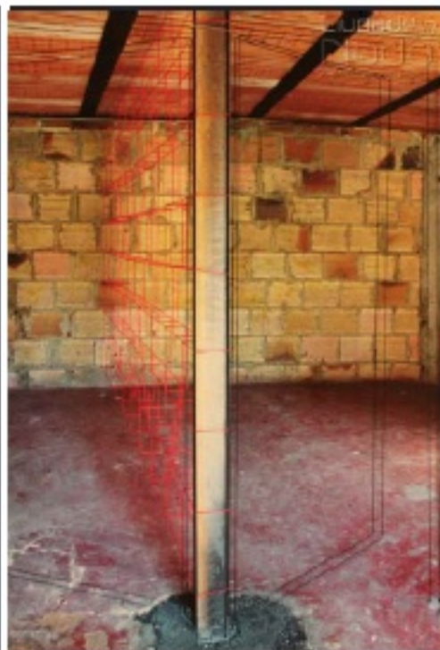
Exposición de Sandra Calvo y Pedro Ortiz Antoraz